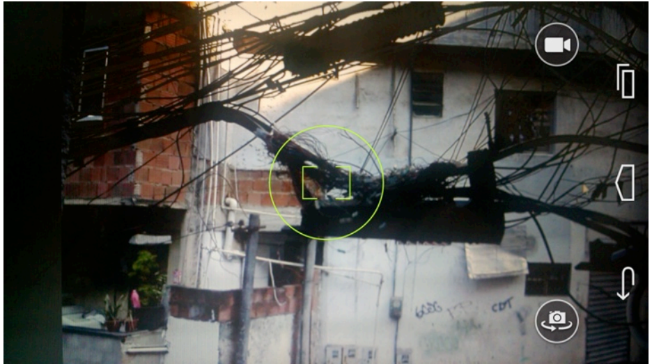
Imagem captura pela câmera do celular, através do aplicativo Voices of Youth

Enquanto o participante realiza essas etapas, o GPS do aparelho localiza com precisão o ponto de onde a foto foi tirada, para que esta seja identificada corretamente no servidor de mapas. Para aumentar a eficácia da localização, é recomendável que o participante não saia do local fotografado até que o aplicativo encontre a posição.