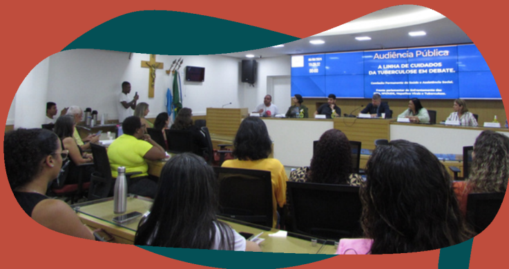
Audiência pública promovida pela Frente Parlamentar de Enfrentamento às IST, HIV/Aids, Hepatites Virais e Tuberculose em São Gonçalo