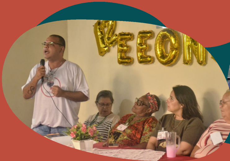
12º Encontro Estadual de Ong/Aids do Estado do Rio de Janeiro