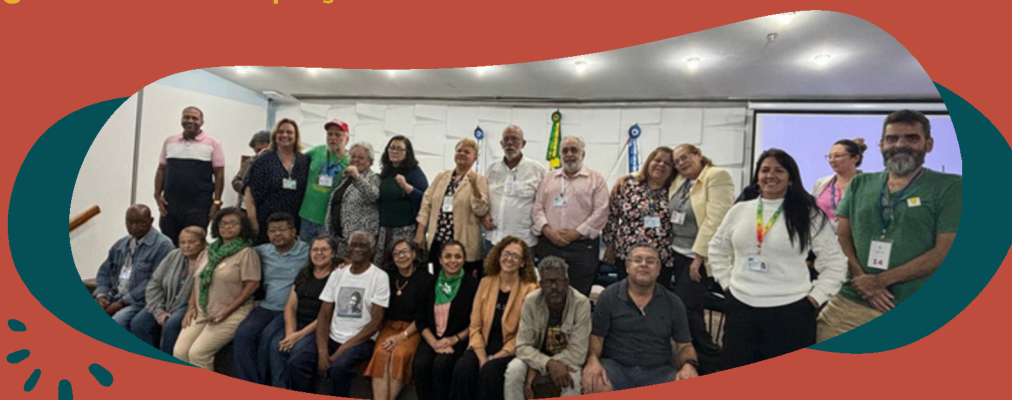
Reunião ordinária do Conselho Municipal de Saúde do Rio de Janeiro