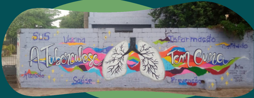
Mural informativo com grafite sobre tuberculose