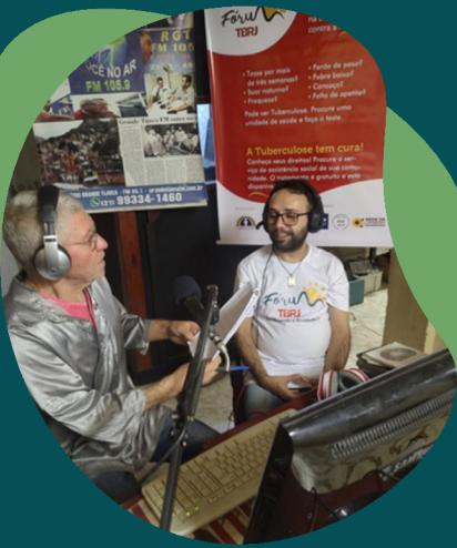
Mensagens informativas na Rádio Comunitária