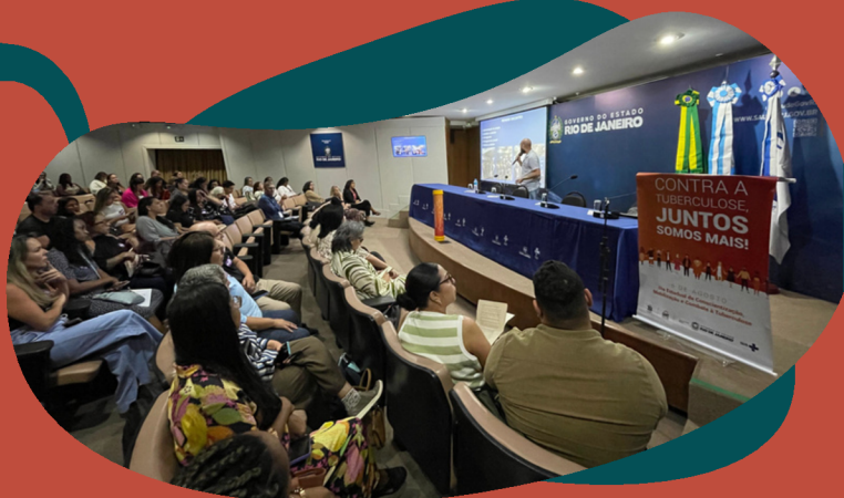
Evento organizado pela Secretaria de Estado de Saúde do Rio de Janeiro (SES-RJ) com foco em educação e mobilização em tuberculose