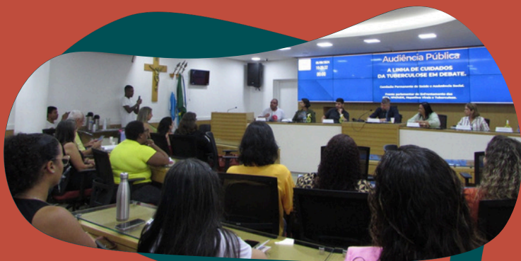
Audiência pública promovida pela Frente Parlamentar de Enfrentamento às IST, HIV/Aids, Hepatites Virais e Tuberculose em São Gonçalo