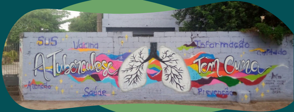
Mural informativo com grafite sobre tuberculose