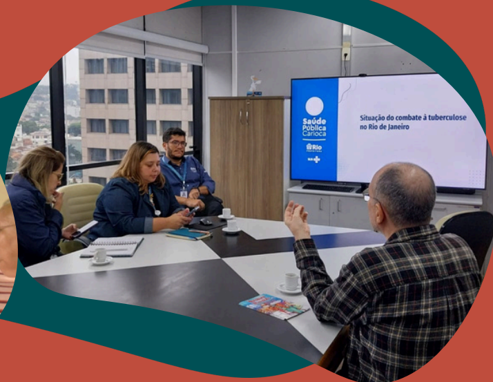
Reunião com a Secretária Municipal de Saúde (SMS Rio)