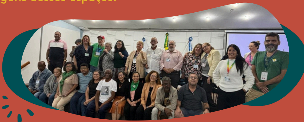
Reunião ordinária do Conselho Municipal de Saúde do Rio de Janeiro