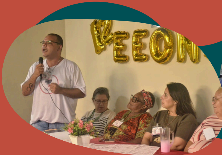
12º Encontro Estadual de Ong/Aids do Estado do Rio de Janeiro