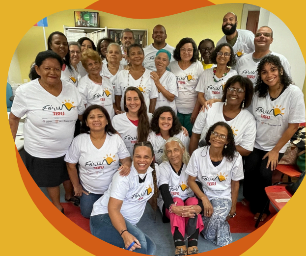
Reunião mensal com os Agentes

Os planos são formulados pelos ativistas sociais que vivenciam diretamente os problemas identificados nos territórios, utilizando a metodologia Construção Compartilhada de Soluções Locais que está baseada em 2 etapas complementares: