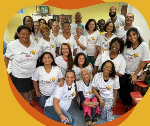
Reunião mensal com os Agentes

Os planos são formulados pelos ativistas sociais que vivenciam diretamente os problemas identificados nos territórios, utilizando a metodologia Construção Compartilhada de Soluções Locais que está baseada em 2 etapas complementares: