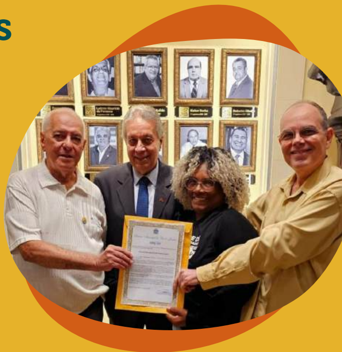
Moção na Câmara Municipal do Rio de Janeiro

Em agosto de 2023, o Fórum TB-RJ recebeu uma moção na Câmara Municipal do Rio de Janeiro, em homenagem aos seus 20 anos de atuação; no mesmo mês, seus ativistas também participaram do Dia Municipal de Conscientização, Mobilização e Combate à TB em Itaboraí, da instalação da Frente Parlamentar de Combate e Prevenção à Tuberculose, HIV e Diabetes na ALERJ, e da Reunião da Rede Brasileira de Comitês.