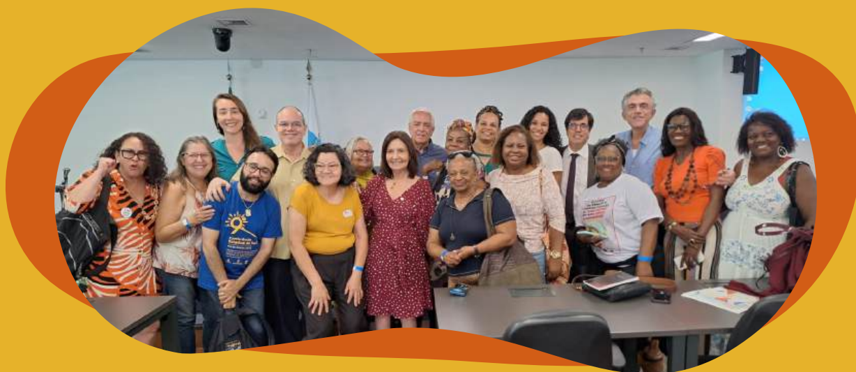
Participação em audiências públicas

Já em setembro e outubro de 2023, os ativistas do Fórum participaram de 3 audiências públicas organizadas pela Frente Parlamentar de Combate e Prevenção à Tuberculose, HIV e Diabetes, para monitorar o investimento da ALERJ de 246,5 milhões destinada ao programa de Tuberculose do Estado do Rio de Janeiro / SES-RJ. E no mês de outubro, estiveram presentes em um encontro da sociedade civil com o Ministério da Saúde e OPAS, para escuta das demandas relacionadas ao enfrentamento da tuberculose no Estado do Rio de Janeiro.