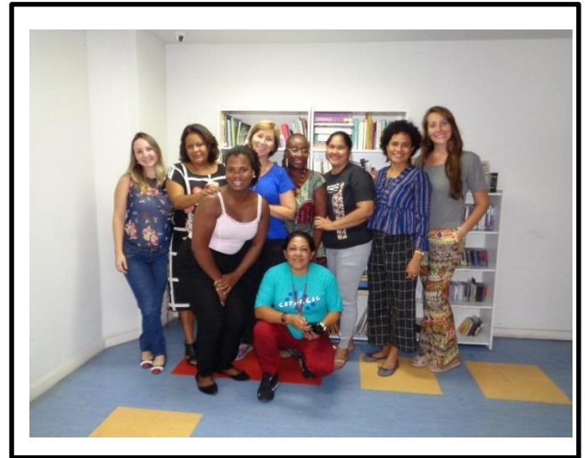
Reunião de Planejamento com os 05 articuladores regionais.